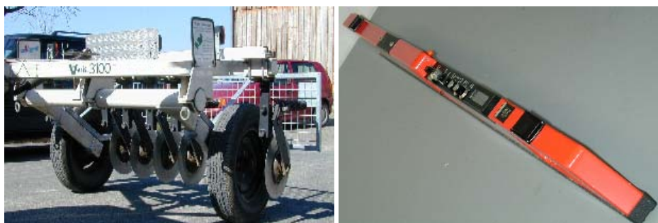
شکل ۱- راست) سنسور الکترومغناطیس EM38 و چپ) سنسور الکتروودی VERIS3100.

منطقه مورد مطالعه: مطالعات اولیه این پژوهش در یک مزرعه ۱۶/۶ هکتاری در موسسه تکنولوژی کشاورزی و مهندسی بیوسیستم واقع در شهر برانشوایک، کشور آلمان صورت پذیرفت. معرفی سنسورهای EM38 و VERIS3100: این سنسورها را به‌طور جداگانه نشان می‌دهد. این سنسورها ECa را در ضمن کشیده شدن بر روی خاک مزرعه و روی مسیری شبکه‌بندی شده اندازه‌گیری می‌کنند. عمق اسمی اندازه‌گیری سنسور EM38 معادل عمقی است که ۷۰ درصد جمععی سیگنال‌ها تا آن عمق نفوذ کرده باشند. در این شرایط وقتی این سنسور در وضعیت افقی و یا عمودی قرار می‌گیرد، عمق اسمی اندازه‌گیری آن به ترتیب برابر ۰/۷۵ متر و ۱/۵ متر بوده (مک‌نیل، ۱۹۸۰) که در این پژوهش به اختصار EM38-h و EM38-v نامیده می‌شوند (شکل ۱- الف و ب).