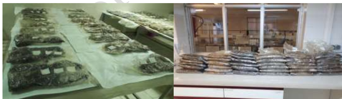
شکل ۱- فرمولاسیون‌های قارچی تهیه شده با حامل‌های مختلف.

سترون جمع‌آوری شدند. برای شمارش اسپورها در سوسپانسیون از لام هموسایتومتر استفاده گردید. عمل شمارش اسپورها از یک نمونه سوسپانسیون چندین بار و با بزرگنمایی ۴۰۰ برابر میکروسکوپ نوری انجام گرفت و میانگین شمارش‌ها به عنوان تراکم جمعیت سوسپانسیون نمونه اصلی در نظر گرفته شد (۲۱). براساس تراکم جمعیت نمونه‌های سوسپانسیون، یک میلی‌لیتر سوسپانسیون اسپور با جمعیت 1.06 \text{ CFU/mL} تهیه شد و به کیسه‌های پلی‌پروپیلن با فیلتر ۰/۲ میکرومتری که به مدت دو ساعت در دمای ۱۲۱ درجه سلسیوس و فشار یک اتمسفر سترون گردیده بودند منتقل شد. کیسه‌های پلی‌پروپیلن حاوی مخلوطی از مواد غذایی شامل آرد ذرت (۵۰ گرم)، آرد گندم (۵۰ گرم) و هر یک از حامل‌ها (۹۰۰ گرم) و ۳۰۰ میلی‌لیتر آب مقطر بودند. حامل‌های استفاده شده در این پژوهش شامل ورمیکولیت ۱-۳ میلی‌متری خمین، پوکه معدنی ماسه‌ای ۰-۴ میلی‌متری اردبیل، پرلیت دانه ریز ۱-۳ میلی‌متری گیلان، خاک اره شرکت چوب و کاغذ ایران (چوکا)، کمپوست بقایای گیاهی مؤسسه تحقیقات خاک و آب و